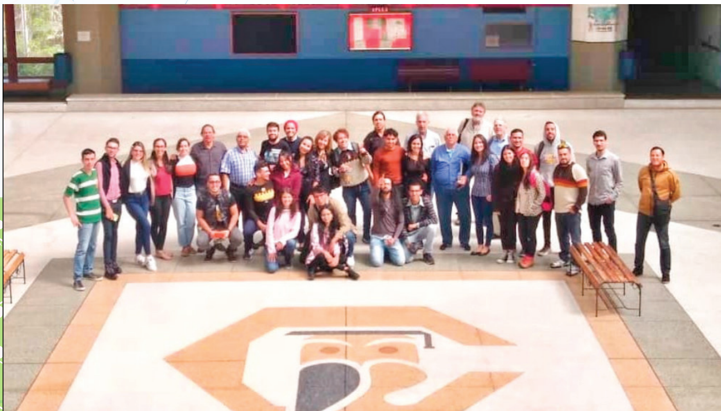
Participantes de la iniciativa “Mi proyecto en 180 segundos”