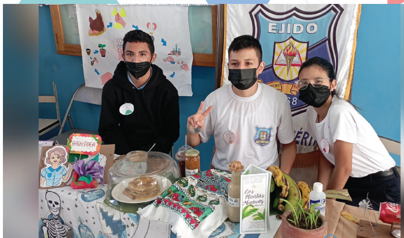
Proyecto "Aprovechamiento y transformación del Plátano"

gisterio, el proyecto "Aprovechamiento de la energía solar mediante paneles" del Liceo Humberto Fernández Morán, el proyecto "Aprovechamiento y transformación del Plátano" del Liceo Bolivariano Ejido, y el proyecto "Como vivir con un padecimiento del Corazón" de la Unidad Educativa Rómulo Betancourt.