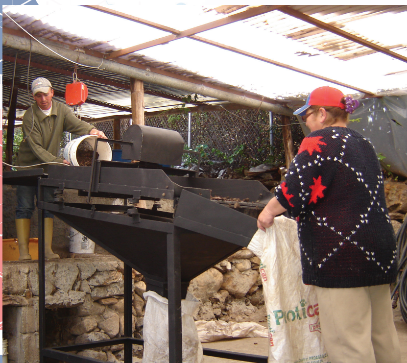
Integrantes del Colectivo Piedra Mubay

Según los investigadores, los integrantes del Colectivo Piedra Mubay afirman que las formaciones que han recibido por parte de los distintos entes adscritos al Mincyt, han contribuido en el mejoramiento de sus procesos productivos, destacando que Fundacite Mérida les apoyó con la realización de talleres sobre la producción de las lombrices para el manejo del compost, adecuación de equipos y la donación de la cernidora del humus sólido, actividad que antes solo podían realizar de manera manual.