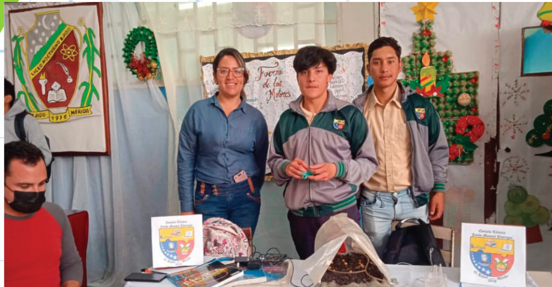
Proyecto "Electromagnetismo aplicado a la producción agrícola dentro del invernadero"

Entre las temáticas que definieron las categorías premiadas se encuentran, el cambio climático, ciencia productiva e innovando ando en pro de la ciencia para la vida.